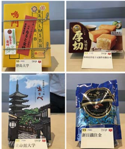
図 3 ご当地手土産

にした。結果として 30 数名と多くの方々からお土産の提供を受け、2 テーブル×2 カ所に並べて、懇親の場を設けた。お土産の一例を図 3 に示す。懇親会では、お土産を持参した方に自己紹介を兼ねてお土産の紹介を行って頂いた。余ったお土産とみかんは、用意した小袋に各自で詰めて持ち帰ってもらった。懇親会は 1 時間ほどと短いものであったが、様々な種類のお土産を介して参加者同士の親睦が深まったものと思われる。