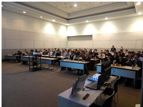
図 1 聴講の様子

前節に関連した目視検査支援機器のデモ展示が 3 社によって行われた。設置場所は、会場前方の両サイドであり(図 1 参照),会場を出ることなく見て、その場で試してみる工夫をした。