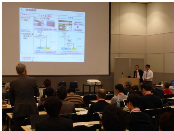
図 2 改善事例報告時の熱い討論

介は、取組時の現場の苦勞がひしひしと伝わる素晴らしい発表であった。一方、上層からの支援が受けられず現場サイドで導入のための試行錯誤を行っているとの発表もあった。様々な現場技術者の発表に、質疑応答は熱を帯び、予定の時間を大幅に越えての討論が続いた。参加者にとってもっとも役立つセッションとなったようである(図 2 参照)。