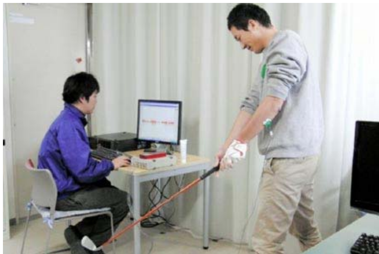
エルゴグリップの性能分析を行う香川大の学生＝香川県高松市林町、香川大工学部

松岡手袋(香川県東かがわ市)は、人間工学に基づき開発したスポーツ手袋「エルゴグリップ」の性能分析を地元大学と連携して取り組んでいる。ゴルフ用手袋ですでに、従来の手袋よりも効率的にクラブに力が伝わるのがデータで裏付けられており、商品の優れた性能をさらに数値化することで、商品力強化を図るほか、今後の商品改良にも生かす。